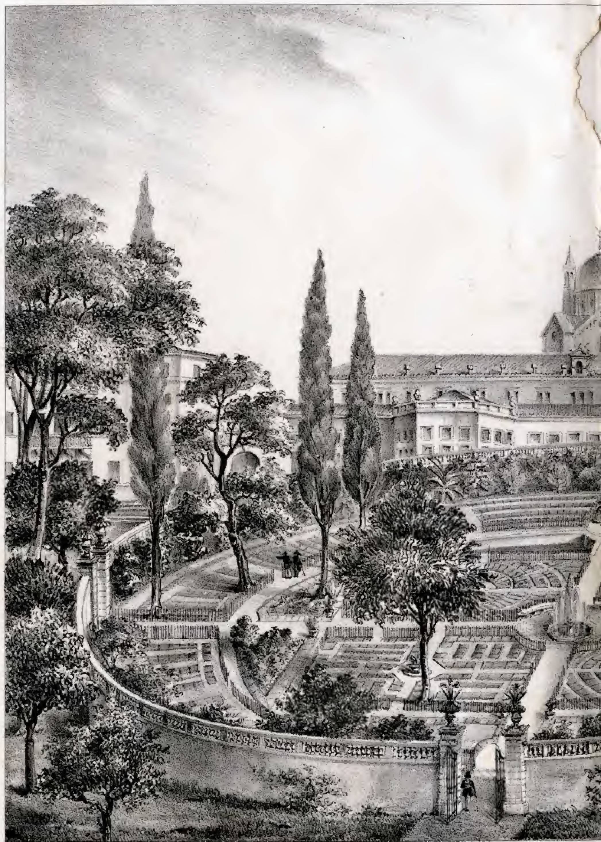
G. Agostini dis. in pietra